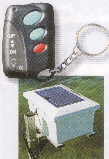
Med fjernbetjening og solceller på akkumulatorboksen er der ikke behov for ekstern tilslutning.

Når båden er sejlet ind over liften trykker man på den medfølgende fjernbetjening og vupti op kommer båden. Myndighederne i Danmark forbyder personløft med en bådlift, men vi valgte alligevel at satse livet på apparatet og det gik fint. Ingen støj, ingen panik, ingen fendere,