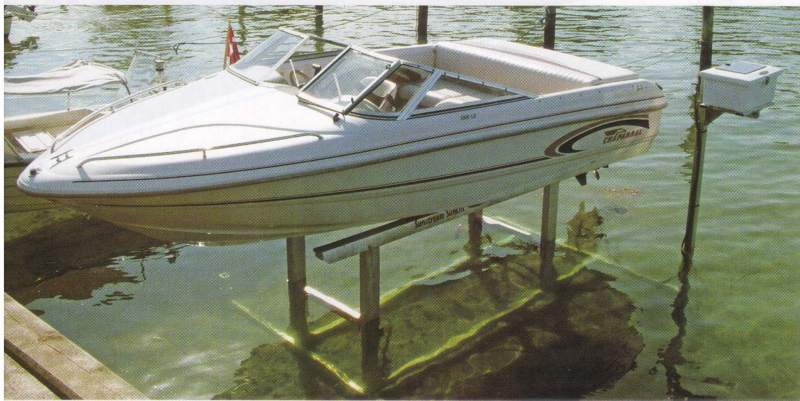
Båden får ingen begroning og ligger ikke og knubber op ad nabobådene.

ingen knob, ingen bundmaling, ingen begroning, ingen frygt for at båden synker, ingen spildplads mellem bådene hvis der er flere lifte opstillet ved siden af hinanden, kun solenergi og lidt moderne teknologi. Skinner solen hele året er der næsten tale om en økologisk evighedsmaskine. Og vis os den tyveknekt, der orker at stjæle en båd, der står på stylder ude i vandet.